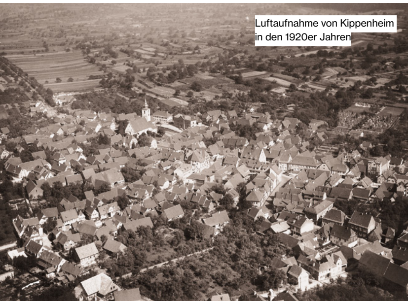
Luftaufnahme von Kippenheim in den 1920er Jahren